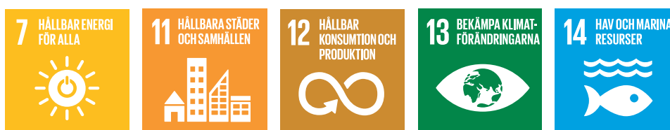
Figur 1 Avfallsplanen har kopplingar till flera av de globala målen.

På en övergripande nivå kopplar avfallsplanens mål till de globala målen Hållbar energi för alla, Hållbara städer och samhällen, Hållbar konsumtion och produktion, Hav och marina resurser, samt Bekämpa klimatförändringar.